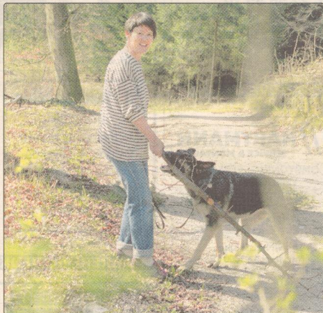
Det er godt med en tur i skoven for både menneske og dyr. Men tjek hunden for skovflåt. Det lille dyr er for det meste ufarligt for dyret, mens mennesker reagerer stærkere.

Hvis du opdager en skovflåt, der har sat sig fast på dit kæledyr - eller dig selv - fjerner du den bedst enten ved et jævnt træk med to fingre eller med en flåttang, som griber omkring flåten, der herefter