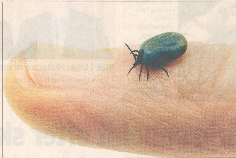
Skovflåten - lille og let at overse, men farlig hvis man ikke passer på.

Han anbefaler desuden at klippe græsset i stikanter, så ingen græs rager ind over en sti og giver godt afsæt for en mide. Han anbefaler, at man tager nogle gummistøvler og et par lyse bukser på, hvis man skal ud i højt græs, for så kan dyrene ses og nemmere fjernes.